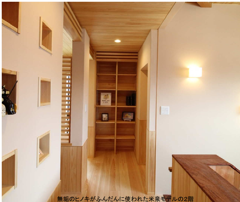
無垢のヒノキがふんだんに使われた米泉モデルの2階

かつては機能性やスペックを競い続けた洗剤や柔軟剤も、今では香りつきが大人気です。ボールペンであっても新しい香りをつけた方が人気なんだそうです。その反面、人工的な香料に抵抗を示し気分が悪くなる方も増えてきました。やはり人工香料に含まれる材料は体にも悪影響がありそうです。